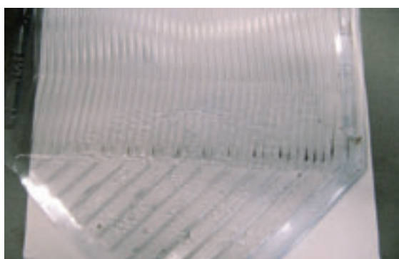
4. Onderzijde toevoer (swab-monster 8), aan de achterzijde is condens zichtbaar.