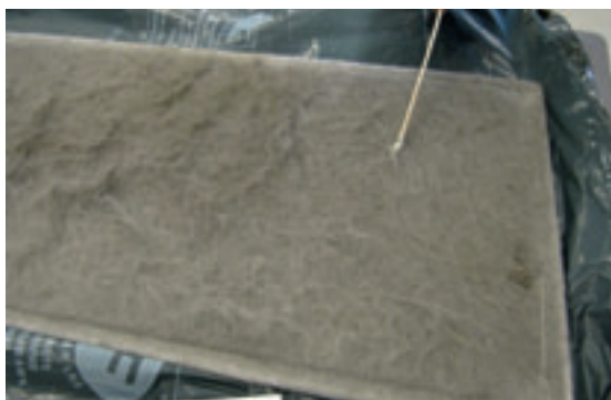
3. Binnenluchtfilter (swab-monster 3).