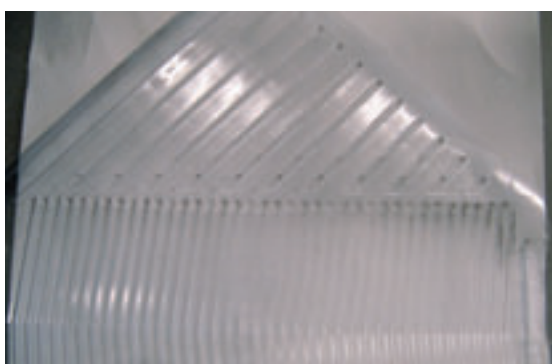
5. Bovenzijde toevoer (swab-monster 9).

ziet er schoon uit, hetzelfde geldt voor de afvoer, hier is echter aan de onderkant – waar condens aanwezig is – geen verontreiniging zichtbaar.